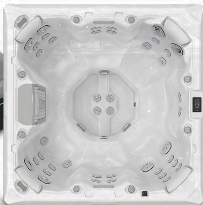
↑ Premium edition