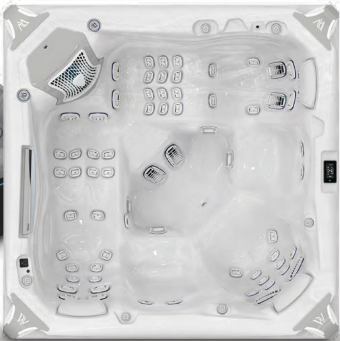
↑ Édition Premium