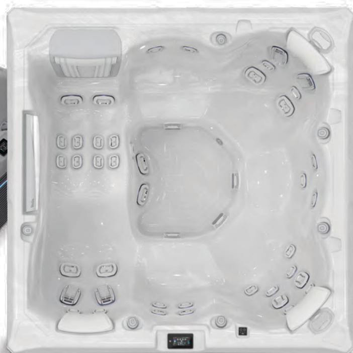
↑ Édition Premium